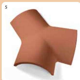
Tjegull shpërndarëse e brinjëve