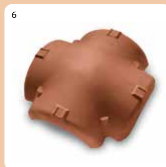
Tjegull shpërndarëse e brinjëve (me 4 dalje)