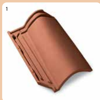
Tjegull e plotë 1/1