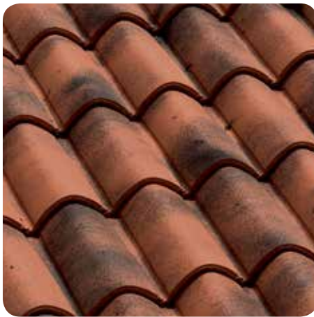
PRESTIGE ROSSO ANTICO